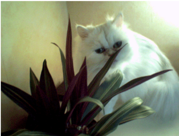
Jag fascineras alltid över hur vig min kisse är.