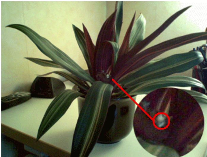
Gazzy inspekterar den nya blomman.